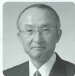
トヨタ自動車株式会社 取締役社長 渡辺 捷昭氏

今回のような取り組みを通じ、この豊田市がより魅力のある、美しく品格のある都市として、わが国だけでなく世界の都心整備のモデルとなることを期待し、皆さまの取り組みに対し、国土交通省も最大限の協力を申し上げたいと存じます。