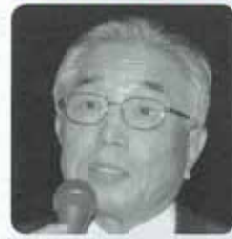
鈴木 公平氏 (豊田市長)

※ITS=Intelligent Transportation Systems の略